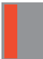
1/3 Pagina verticale 780 €